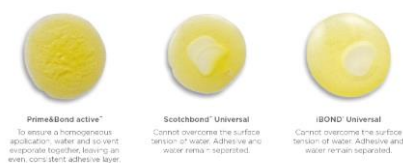
Fig. 3: L'adesivo universale Prime&Bond active garantisce, a diversi livelli di umidità, uno strato omogeneo e un forte legame adesivo.