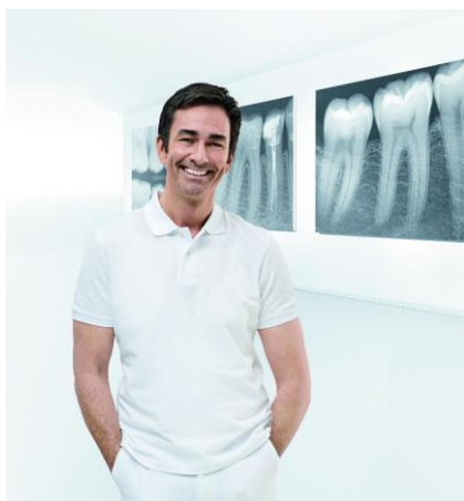
Fig. 1: Le radiografie intraorali costituiscono la base per la diagnosi in molte indicazioni e possono essere integrate in modo semplice, rapido e sicuro in un flusso di lavoro digitale.