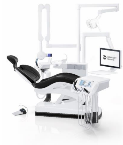
Fig. 3: Collegamento digitale e integrazione di funzioni, fanno la differenza nella nuova generazione di riuniti di Dentsply Sirona. Teneo può essere allestito con il radiografico intraorale Heliodent Plus e con il monitor HD Sivision da 22".