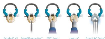
Fig. 1: Dentsply Sirona Restorative offre l'unica soluzione completa per ottimizzare il restauro di classe II.