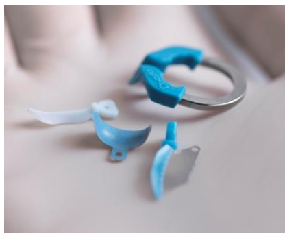
Fig. 2: Palodent V3 rappresenta il primo passo verso un migliore successo clinico del restauro di classe II.