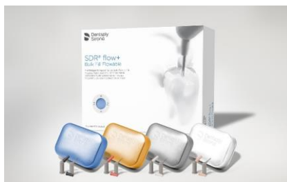
Fig. 4: SDR flow+: l'inimitabile tecnologia bulk fill SDR ora si presenta con una gamma più ampia di colori e permette anche indicazioni aggiuntive (classe III e V).