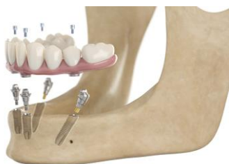
Fig. 1 : Le concept SmartFix