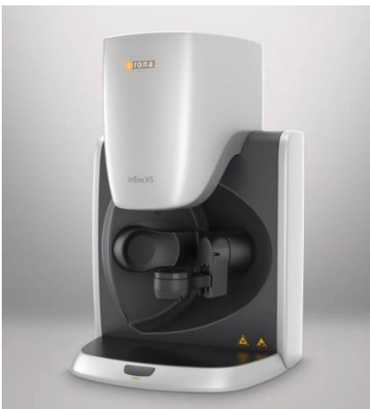
Fig. 3 : Haute précision et facilité d'utilisation - le scanner de laboratoire inEos X5.