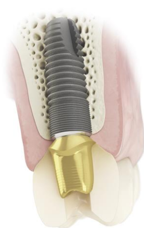
Fig. 2 : Solution Atlantis CustomBase