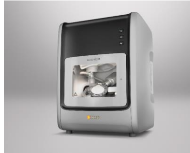
Fig. 2 : L'unité de fraisage à 5 axes inLab MC X5 séduit par sa polyvalence. Elle offre le plus grand choix de matériaux sur le marché et est ouverte pour la réalisation de restaurations provenant d'autres logiciels CAO.