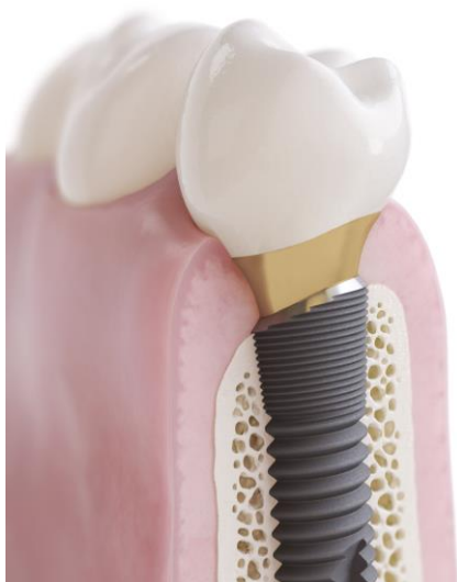
Fig. 3 : Implant OsseoSpeed Profile EV