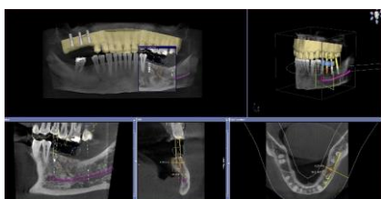
Fig. 1 : Une planification minutieuse du traitement implantaire est plus sûre pour le praticien et pour le patient. Dentsply Sirona a harmonisé tous ses flux de travail.