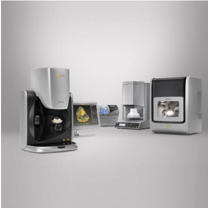
Fig. 1 : L'intégralité du flux de travail numérique tout-en-un : Le système inLab offre tout, du scanner au four de frittage et est simultanément ouvert à la combinaison avec d'autres systèmes.