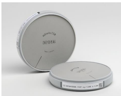
Fig. 5 : Nouveauté dans la gamme de matériaux de Dentsply Sirona CAD/CAM : le disque en métal fritté inCoris CCB.