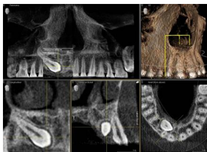
Fig. 1 : Le nouveau mode Low Dose permet d'obtenir pour certaines indications des informations d'images 3D présentant une résolution suffisante avec la dose habituellement utilisée pour les prises de vues 2D.